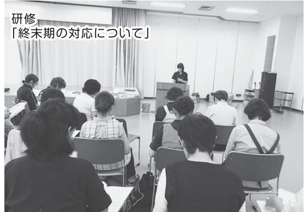
研修 「終末期の対応について」