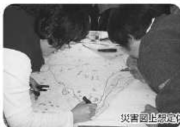
災害図上想定体験(DIG)に挑戦