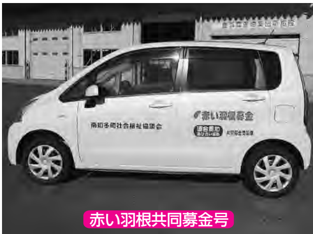
赤い羽根共同募金号