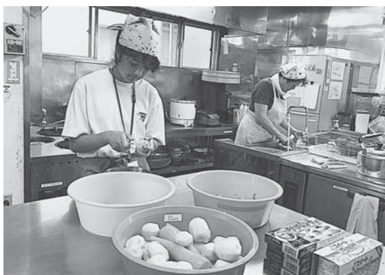
就労継続支援B型うらら（昼食作り）