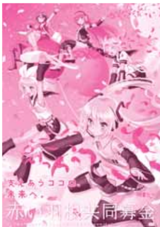
illustration by 白黒にゃん箱 ©Crypton Future Media,INC. www.piapro.net piapro