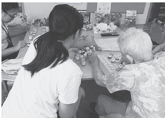
大地の丘（スタッフ手作りパズル）

町内の福祉施設や学校、ご家族のご協力により、中学生が夏休みにボランティア体験学習を行いました。今年度は延べ90名の中学生が参加し、熱心に活動をしました。「楽しかった！またやりたい！」と話す生徒さんもありました。学校や家庭ではできない経験をし、福祉への理解が深まったことと思います。活躍した様子の一部を紹介します。