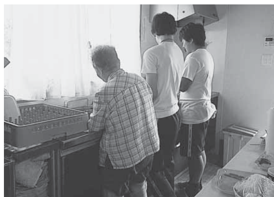
グループホームよつ葉（昼食後後片付け）