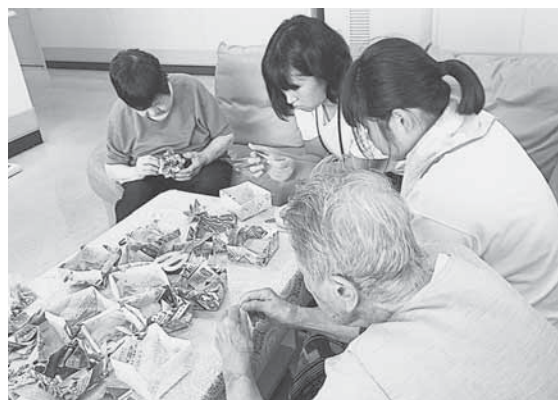
ケアハウスみなみ苑（くす玉作り）