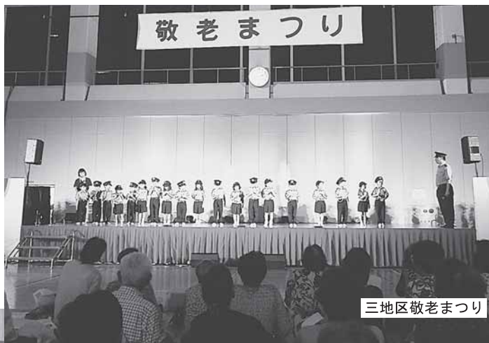
三地区敬老まつり