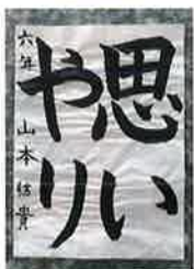
▲みさき小6年 やまもと ゆき 山本 結貴