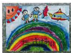
▲みさき小1年 なつめ みさき 夏目 岬