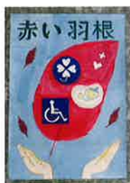
▲内海小5年 えのもと ひなた 榎本 ひなた