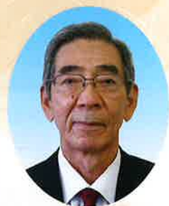
社会福祉法人 南知多町社会福祉協議会 会長