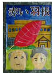
▲みさき小6年 やました はやと 山下 颯斗