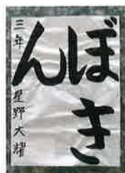
▲豊浜小3年 ほしの たいよう 星野 大耀