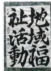
▲南知多中3年 しげや みそら 渋谷 海天