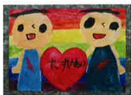
▲みさき小2年 なつめ かつき 夏目 築