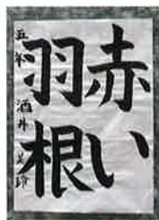
▲みさき小5年 さかい みれい 酒井 美玲