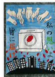
▲南知多中2年 えのもと さおり 榎本 沙織

赤い羽根共同募金中間報告！12月6日現在募金額 2,321,691円 ご協力くださった多くの皆様に厚くお礼申し上げます。南知多町共同募金委員会