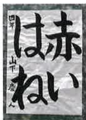
▲みさき小4年 やました けいと 山下 慶人