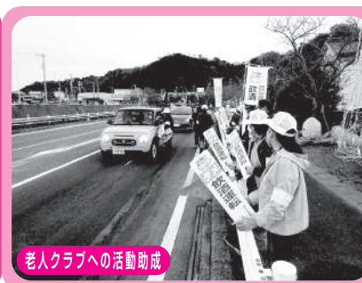
老人クラブへの活動助成