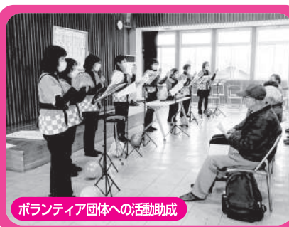
ボランティア団体への活動助成