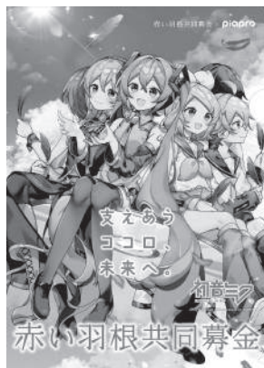
Art by さざなみ © CFM