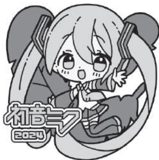
Art by さんご。 © CFM

赤い羽根共同募金と piapro が コラボしました。クリアファイル・ ピンバッジ募金を希望される方は社 会福祉協議会までお越しください。